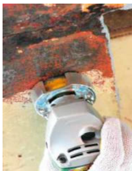
外径 φ60mm 取付穴径 10mm(ISOネジタイプ)