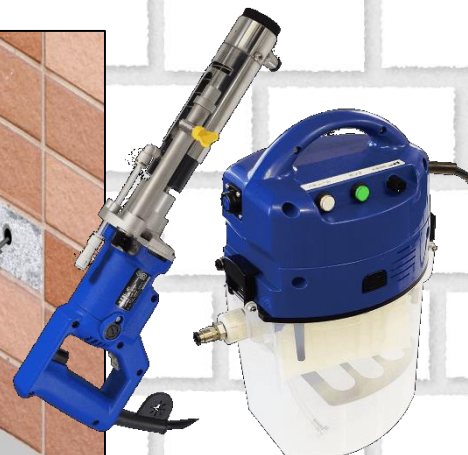
水循環式無振動ドリル メーカー名称：水すましG1