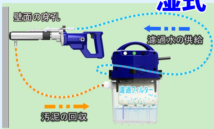
水循環式無振動ドリル／アンカー用 ／アスベスト専用機